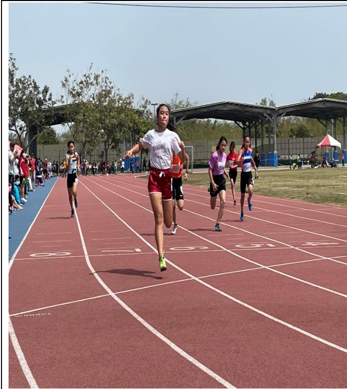
112年全縣運動會田徑賽