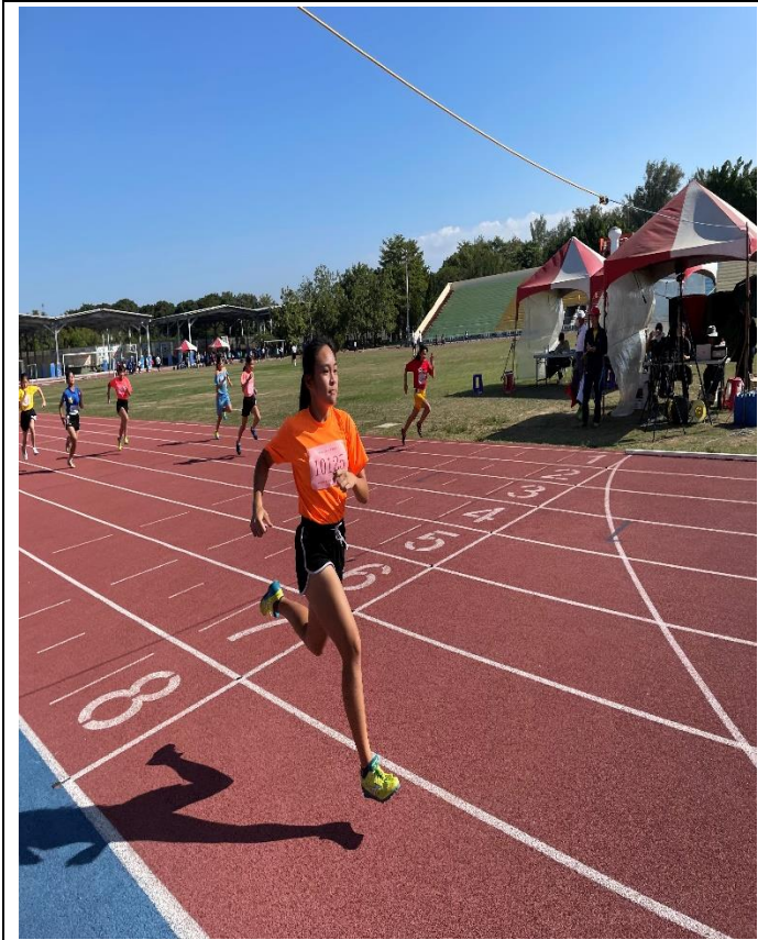
112年師生田徑錦標賽