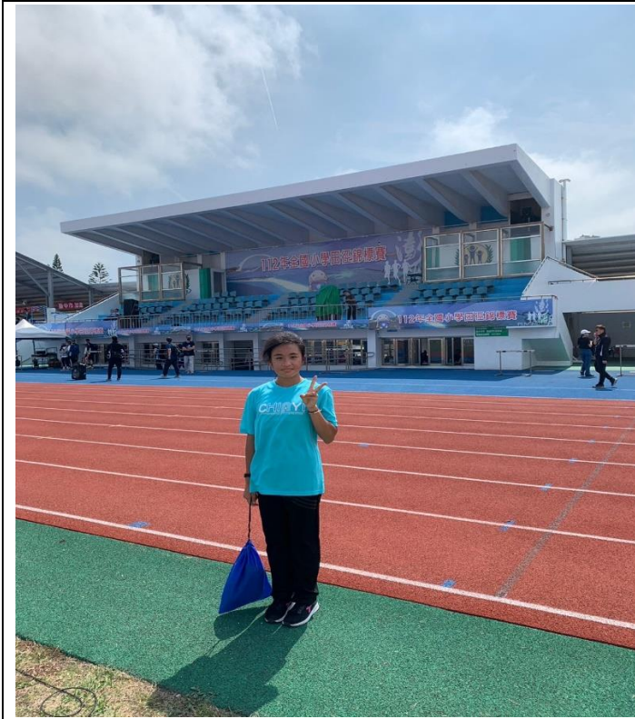
112年全國小學運動會