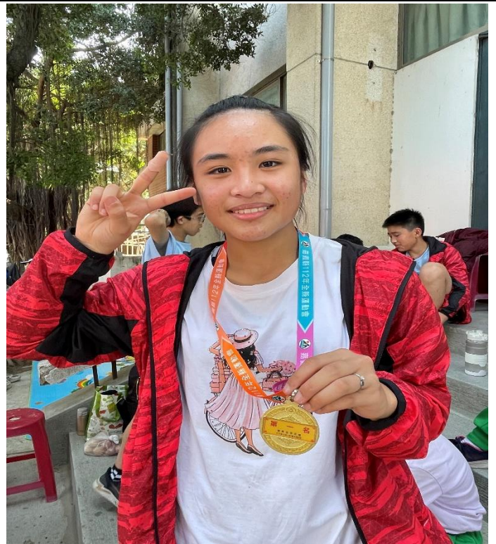
112年全縣運動會田徑賽