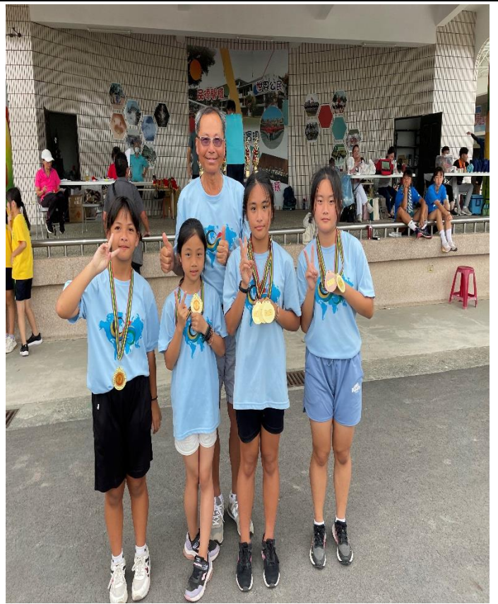
112年師生田徑錦標賽